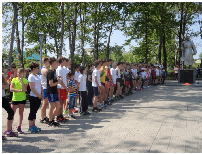
Парад открытия соревнований